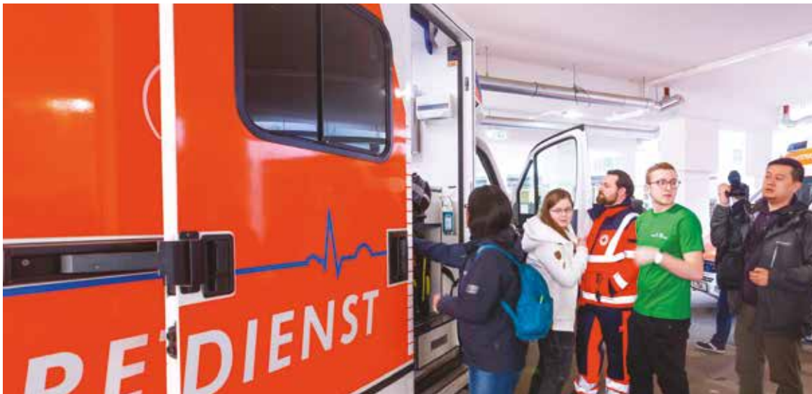
Links: Besucher konnten vor Ort Rettungswagen der Branddirektion Frankfurt und des Deutschen Roten Kreuzes erkunden.