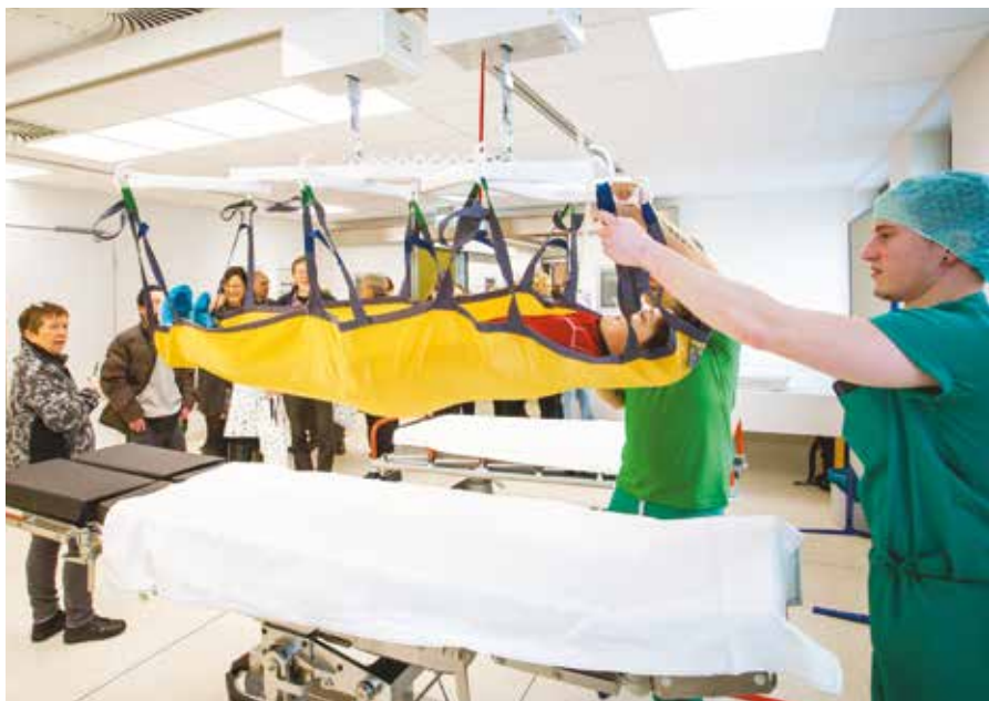
Rechts oben: Das Team des Zentral-OP präsentiert die Umbettungsanlage. Rechts: Besucher inspizieren einen der neuen Operationsäle.