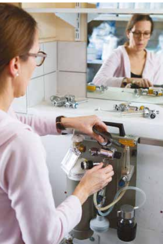
Kein Tag wie der andere: Stationsassistenten bereiten unter anderem Patientenakten auf, sind aber auch dafür zuständig, medizinisches Gerät zu prüfen – wie etwa Sauerstoffflaschen oder Infusionspumpen.

Stationsalltag nie langweilig. „Ich bin die Schnittstelle zwischen Kreißsaal, Pflegekräften, Frauen- und Kinderärzten, Putzteam und Patienten“, fasst sie ihre Position zusammen. Welche Mutter kann entlassen werden und welche Unterlagen benötigt sie dafür? Wann kommt welche Frau aus dem Kreißsaal zurück und wann wird welches Bett frei? Wo muss geputzt werden und sind ausreichend saubere Betten für Mütter und ihre Neugeborenen auf der Station vorrätig? All diese Fragen ballen sich vor allem am Vormittag. „Wenn ab 10.30 Uhr die Frauen auf Station kommen, die einen geplanten Kaiserschnitt hatten, müssen bereits ausreichend saubere Betten bereitstehen“, erklärt sie. Das bedeutet, es müssen