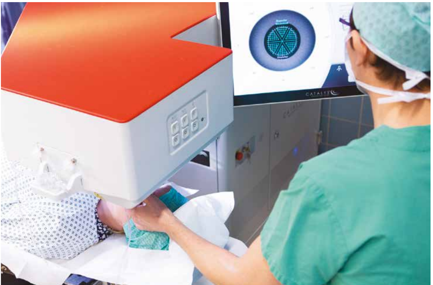
Der neue Femtosekundenlaser ist seit Ende letzten Jahres im Einsatz.