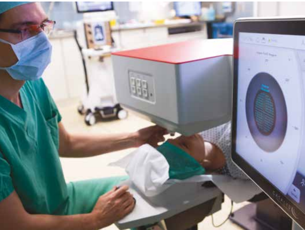
Der Laser arbeitet sehr präzise und öffnet die Linsenkapsel kreisrund, was die weitere Behandlung vereinfacht.

„Die Behandlungsplanung kann auf jedes Auge individuell und sehr genau angepasst werden. Die Öffnung der Linsenkapsel ist perfekt kreisrund und wir benötigen keinen Ultraschall mehr.“