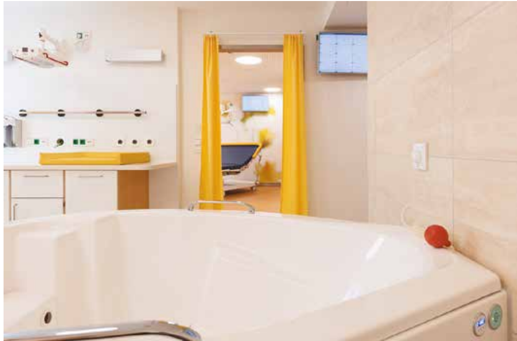
Im Kreißsaal steht werdenden Müttern unter anderem eine Gebärdewanne zur Verfügung.

„Durch die neuen, größeren Kreißsäle werden wir der wachsenden Nachfrage nach Entbindungsmöglichkeiten in Frankfurt und Umgebung gerecht.“