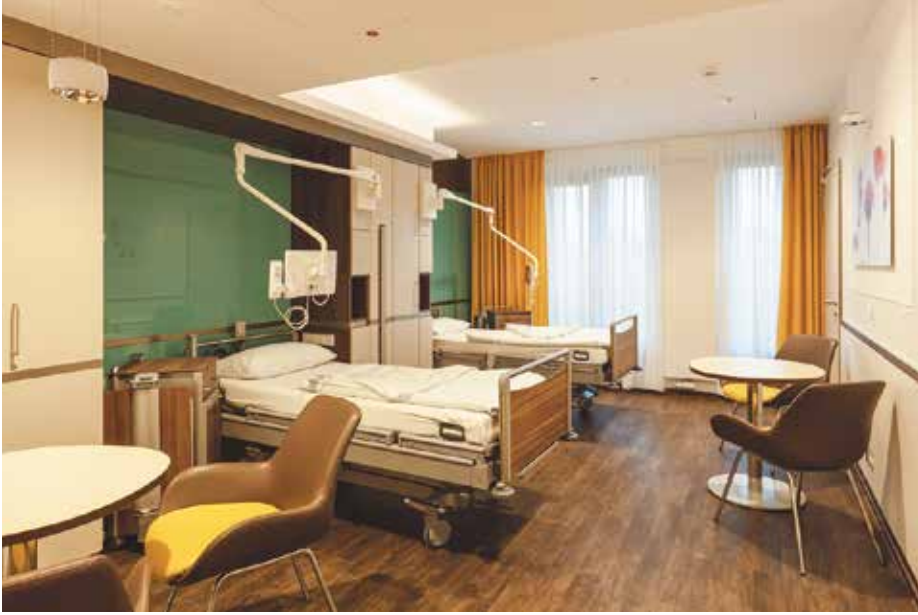
Lichtdurchflutete Patientenzimmer sorgen für eine angenehme Umgebung.