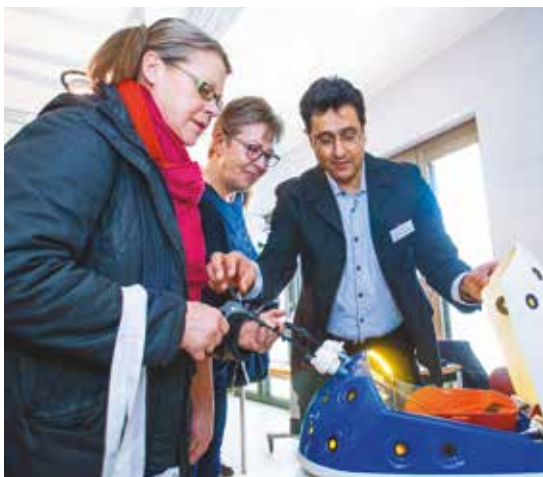
Besucher probieren sich an minimal-invasiven Operationstechniken.